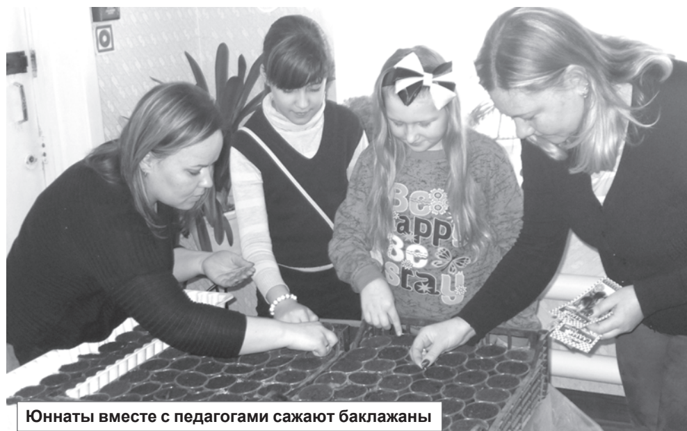
Юннаты вместе с педагогами сажают баклажаны

Ежегодно компания, выигравшая тендер на озеленение города, как правило, обращается именно сюда – на станцию юных натуралистов. За небольшую цену она закупает саженцы и цветы, а педагоги вмес-