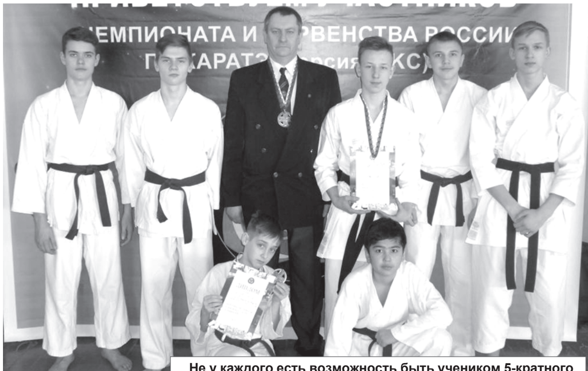
Не у каждого есть возможность быть учеником 5-кратного чемпиона России, двукратного чемпиона Европы и мира.

- Как правило, это ребята 6-7 лет, бывают и исключения, с 5 лет. Потенциал видно сразу: у меня большой опыт, и уже через несколько тренировок могу сказать,